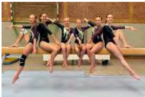
Münsterlandliga 2 in Mettingen

Der Verein gratuliert zu dieser tollen Leistung!