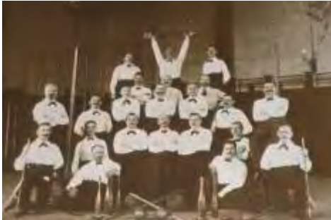
Turnerriege von 1906

Der TV Westfalia 1884 Buer e.V. ist ein traditionsreicher Sportverein mit einer langen Geschichte in Gelsenkirchen-Buer.