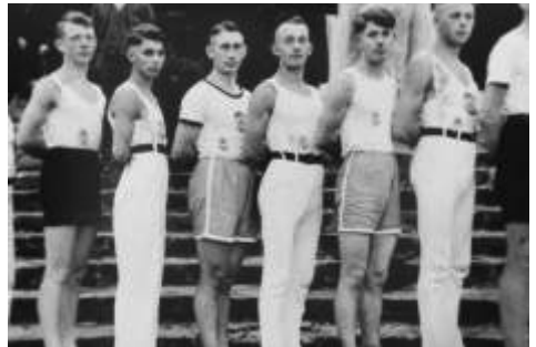
Männerturnerriege von 1928

baut, die sich durch ihre Leistungen und ihr Engagement auszeichnet. Die TurnerInnen haben an zahlreichen regionalen und überregionalen Wettkämpfen teilgenommen und den Verein auf beeindruckende Weise mit namhaften Turnern und Spitzenplatzierungen vertreten.