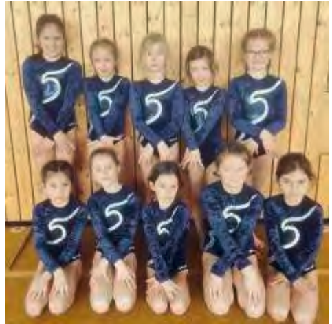
Wetttbewerb Marl 2024

Trotz der fehlenden Qualifikation zum Gauendkampf resümierte die Trainerin schließlich, dass die jungen Turnerinnen wichtige Erfahrungen für sich an diesem Tag sammeln konnten, um sich im wöchentlichen Training weiterhin zu verbessern.