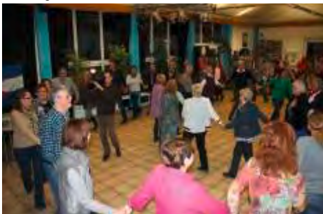
Open Square House