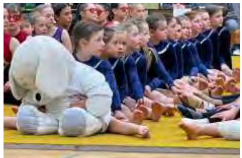
Konzentriertes Zuhören bei der Begrüßung, vorne Maskottchen „Westi“

Der Verein dankt allen Beteiligten und gratuliert den Turnerinnen zu ihren gezeigten Leistungen und den resultierenden Ergebnissen.